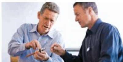
Scarica la Brochure Special Alloys