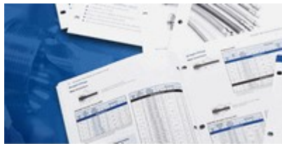
Scarica i Cataloghi dei Prodotti