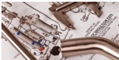
Scarica i Sales Drawings