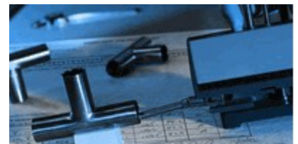
Guarda i Certificati disponibili