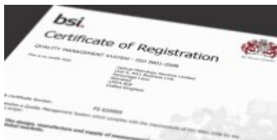
Scarica il Certificato ISO 9001: 2015